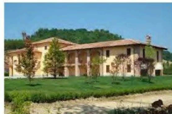
Agriturismo Cascina Roero, (Via Molino Gerotte, 5 - Govone)